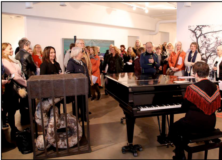
Utstillingsåpninger i 2017